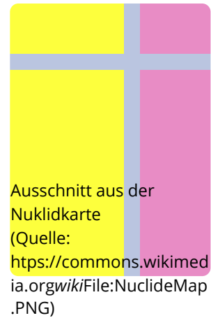
Ausschnitt aus der Nuklidkarte