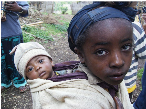
Äthiopien, Region Tigray

abhängig, arm, Alter, Infrastruktur, Lebensstandards, Peripherien, reich, Statistik, Unterschiede, Welt, Wirtschaft, Zentren