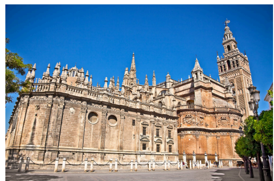
La Catedral en Sevilla