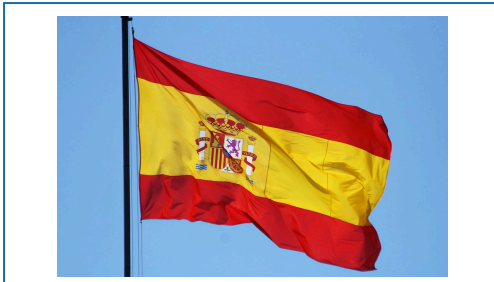
La bandera de España