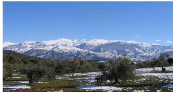
La Sierra Nevada en Andalucía