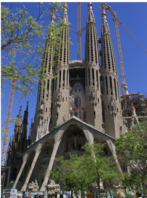
La Sagrada Familia en Barcelona