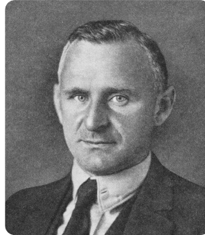
Q1: Carl Friedrich Goerdeler