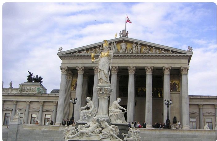
Ringstraße Wien