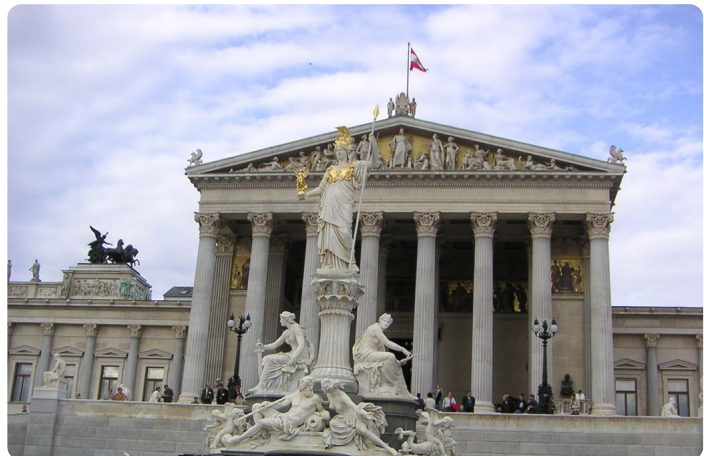
Ringstraße Wien