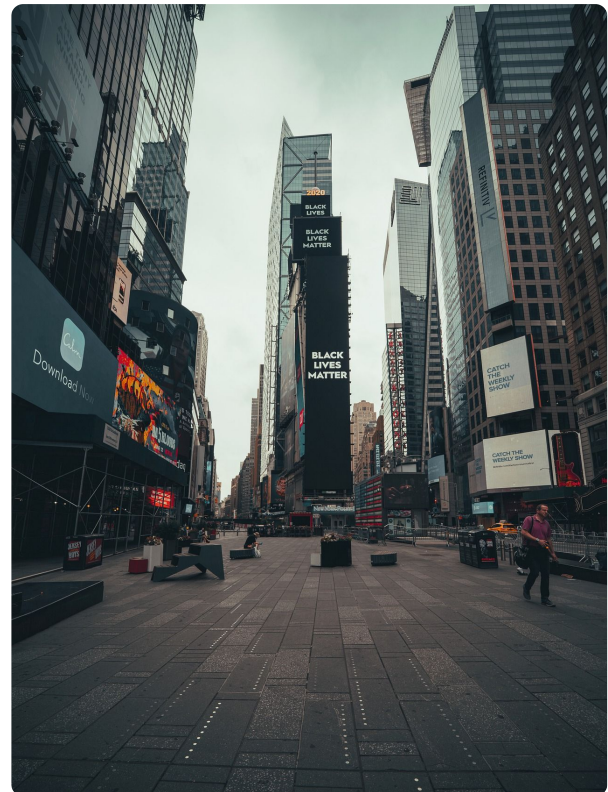
Abb. 1 — 05.06.2020, Time Square, NYC