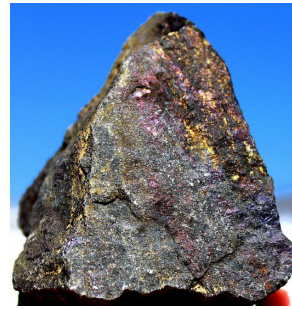
... auch Kupfererz