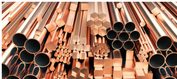
Bauteile aus Kupfer

Im Kunsthandwerk wird Kupferblech getrieben, das heißt durch Hämmern verformt, was aufgrund seiner Weichheit leicht möglich ist. Auch Dächer werden mit Kupferblech gedeckt. Kupferdächer können eine Lebensdauer von mehreren Jahrhunderten haben.