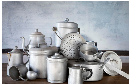
Gegenstände aus Aluminium

Aus Aluminium werden auch Kochtöpfe und andere Küchengeräte, wie die klassische italienische Espressokanne, sowie Reise- und Militär-Geschirr hergestellt.