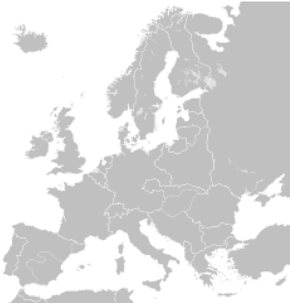
M3: Europa Oktober 1938 - März 1939