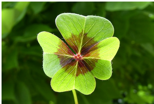
Glücksklee, Oxalis tetraphylla

Albert Schweitzer, Arzt und Philosoph (1875-1965)