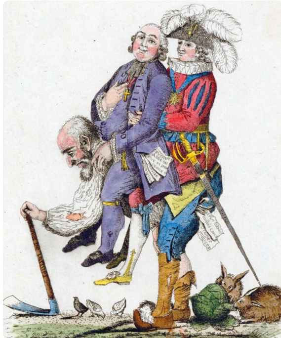
CC BY SA 4.0 segu Geschichte https://creativecommons.org/licenses/by-sa/4.0/ https://segu-geschichte.de/der-dritte-stand/

① Die Bevölkerung Frankreichs vor der Revolution. / 3