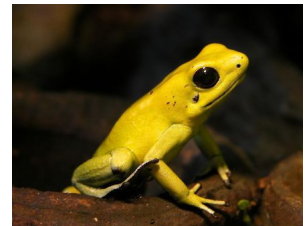
Abb.: ein Frosch aus der Gattung der Baumsteiger

Die Frösche nehmen ihr Gift durch Verspeisen von giftigen Beutetieren auf. Die Giftigkeit von in Gefangenschaft gehaltenen Tieren nimmt mit der Zeit ab, wenn keine geeigneten Futtertiere zur Verfügung stehen. In Gefangenschaft geborene Nachzuchten besitzen in den meisten Fällen kein Hautgift mehr.