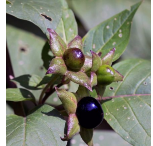
Abb.: die giftigen Beeren der Schwarzen Tollkirsche

Weite Pupillen galten besonders während der Renaissance bei Frauen als schön. Das Einträufeln von Tollkirschen-Extrakt in die Augen bewirkte eine bis zu mehreren Tagen anhaltende Pupillenerweiterung („ feuriger Blick “).