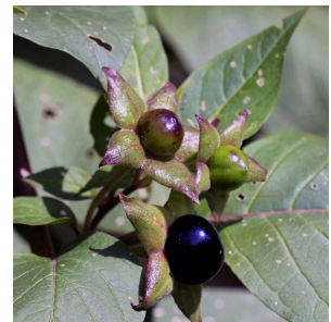
Abb.: die giftigen Beeren der Schwarzen Tollkirsche

Weite Pupillen galten besonders während der Renaissance bei Frauen als schön. Das Einträufeln von Tollkirschen-Extrakt in die Augen bewirkte eine bis zu mehreren Tagen anhaltende Pupillenerweiterung („feuriger Blick“).