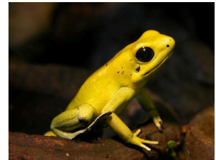
Abb.: ein Frosch aus der Gattung der Baumsteiger

Die Frösche nehmen ihr Gift durch Verspeisen von giftigen Beutetieren auf. Die Giftigkeit von in Gefangenschaft gehaltenen Tieren nimmt mit der Zeit ab, wenn keine geeigneten Futtertiere zur Verfügung stehen.