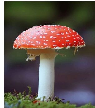
Abb.: der Fruchtkörper eines Fliegenpilzes

Deshalb gilt auch eine Vergiftung durch Fliegenpilze - im Gegensatz zu anderen Pilzen - als weniger schwerwiegend. Es gibt bisher keinen dokumentierten Todesfall, der sich auf den ausschließlichen Verzehr von Fliegenpilzen zurückführen lässt. Es wurde ermittelt, dass mindestens 10 durchschnittlich große Fliegenpilze verzehrt werden müssen, damit eine tödliche Wirkung eintritt.