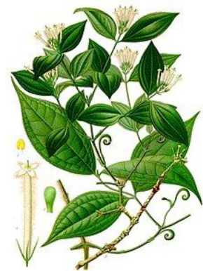
Abb.: eine der Pflanzen, aus denen Curare gewonnen wird

Alexander von Humboldt beschrieb 1804 in seinem Reisebericht detailliert, wie das Curaregift von einem Indianer bzw. Mediziner aus der frisch gesammelten Pflanze Mavacure über die Prozesse Eindampfen und Filtrieren gewonnen wurde.