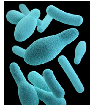
Abb.: Bakterien der Gattung Clostridium

Jährlich wurden vor 2009 in Deutschland 20–40 Fälle von Botulismus gemeldet, von denen 1–2 tödlich endeten. Dabei entwickelt sich das Bakterium aus über die Nahrung aufgenommenen Sporen im Dünndarm und produziert dort die Gifte. In erster Linie sind rohe Lebensmittel gefährdet, die zu warm gelagert werden, z.B. Fleisch- und Fischkonserven, Mayonnaise, aber auch Frucht- oder Gemüsekonserven. Ein wichtiges Indiz bei Konserven ist die Wölbung der Konservendeckel nach außen durch den entstehenden Innendruck.