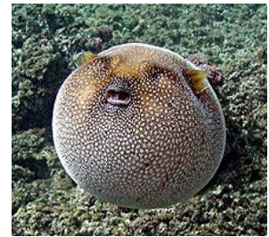
Abb.: ein aufgepumpter Kugelfisch

Fugu (japanisch 河豚) ist eine besonders in Japan beliebte Spezialität, die aus Kugelfisch besteht. Beim Verzehr besteht die Gefahr, sich mit Tetrodotoxin zu vergiften, weshalb Fugu nur von speziell ausgebildeten Köchen hergestellt werden darf.