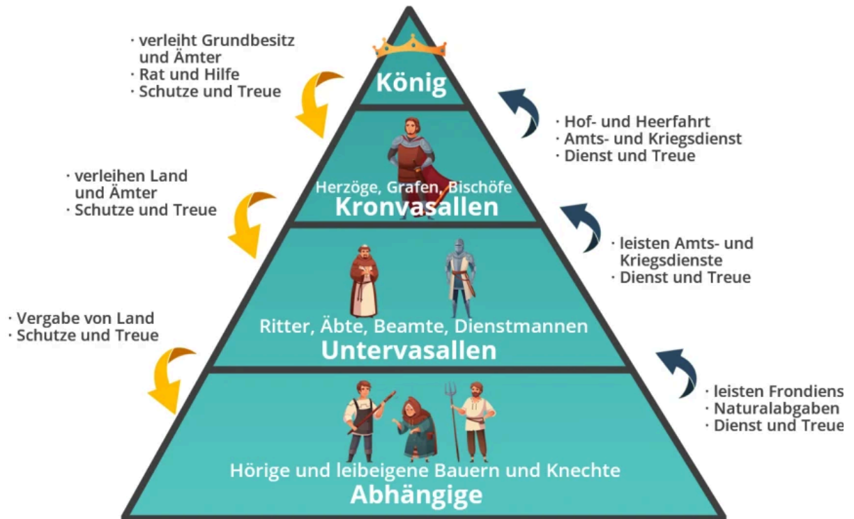
Schaubild zur Ständeordnung des Mittelalters

Die gelben Pfeile markieren die Dienste und Verpflichtungen, die der jeweils obere Stand dem unteren anbietet und schuldig ist.