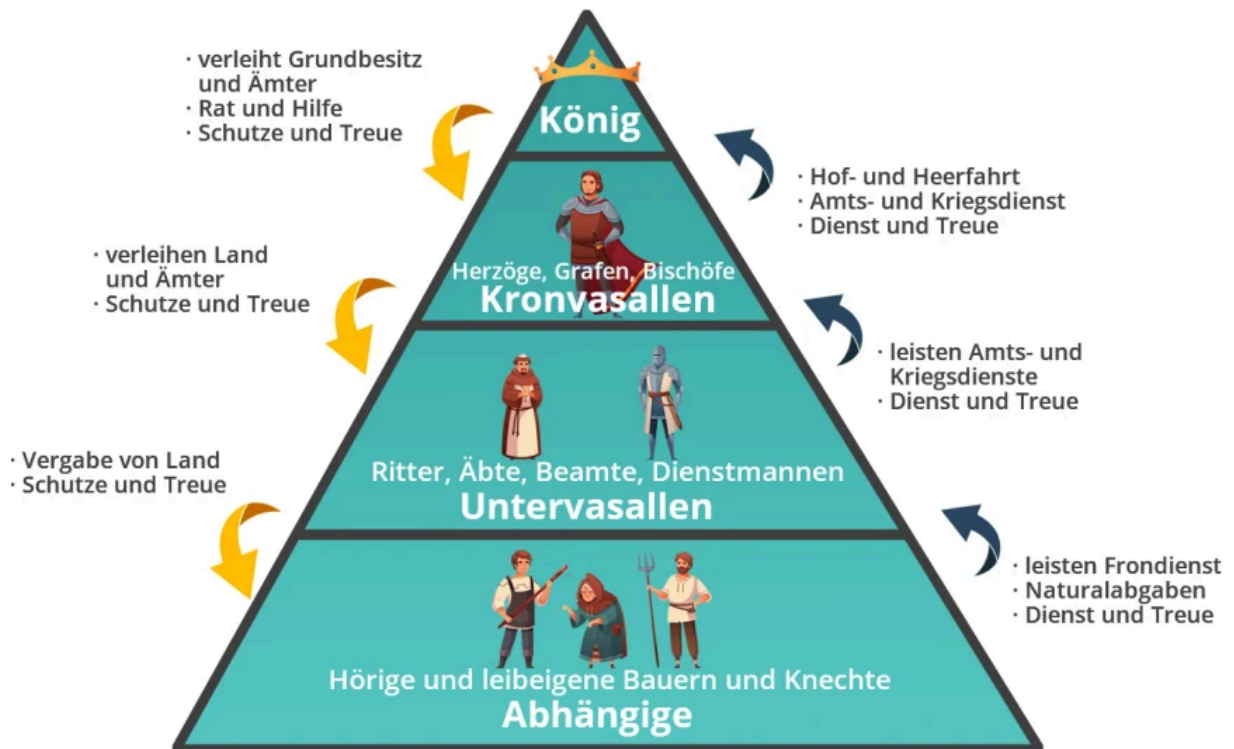
Schaubild zur Ständeordnung des Mittelalters

Die gelben Pfeile markieren die Dienste und Verpflichtungen, die der jeweils obere Stand dem unteren anbietet und schuldig ist.