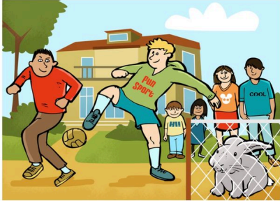
He likes football.

Wenn du eine Person auf Englisch beschreibst, verwende das simple present. Denke an das -s in der 3. Person Singular: She wears a red t-shirt. She likes tennis.