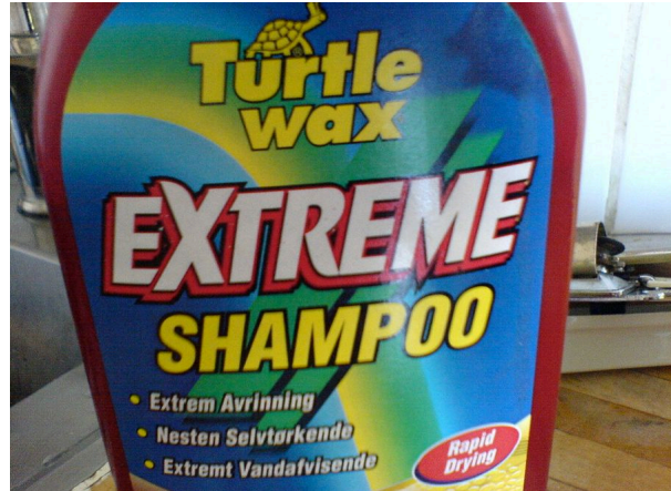
turtle wax extreme shampoo

Was wird mit dem Shampoo verkauft? (Sportlichkeit Naturverbundenheit, Coolness, Glimmer ....)