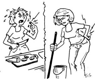
© Abb. von Claudia Styrsky, München, im von Walter: Chronische Schmerzen, Berlin/Heidelberg: Springer-Verlag 2014.

③ Unterscheiden Sie anhand des Videos „akute vs chronische Schmerzen“ eben diese. Stellen Sie Unterschiede gegenüber.