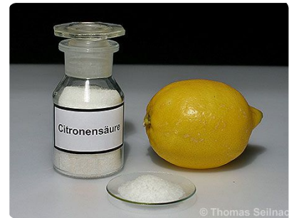
Abb. 1: Zitronensäure

Es müssen also in jeder sauren Lösung Wasserstoff-Ionen (H + ) vorliegen. Diese Ionen sind für die sauren Eigenschaften verantwortlich. Die Wasserstoff-Ionen nennt man auch Protonen. Löst man eine Säure in Wasser, werden dabei immer Protonen frei. Daher bezeichnet man Säuren auch als Protonendonatoren (Donator lateinisch: schenken oder abgeben).