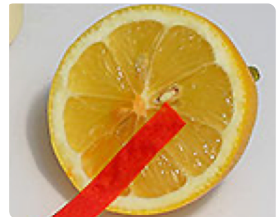
Abb. 2: Indikatorpapier an einer Zitrone