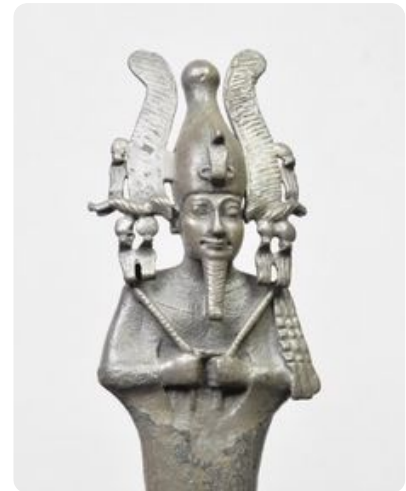
M1: Statuette Osiris, stehend mit Atef-Krone