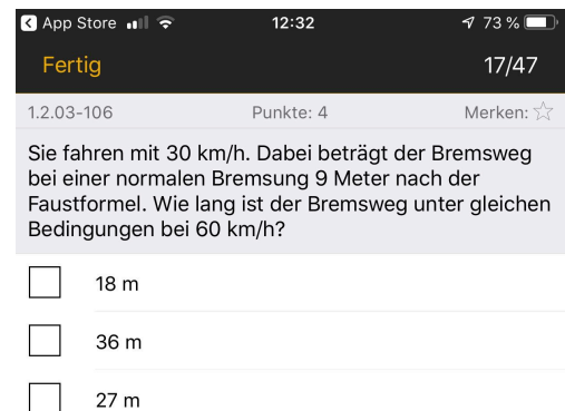
Screenshot der Führerschein-Übungsapp „Führerschein 2019“