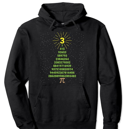
Weihnachts-Pulli für Nerds