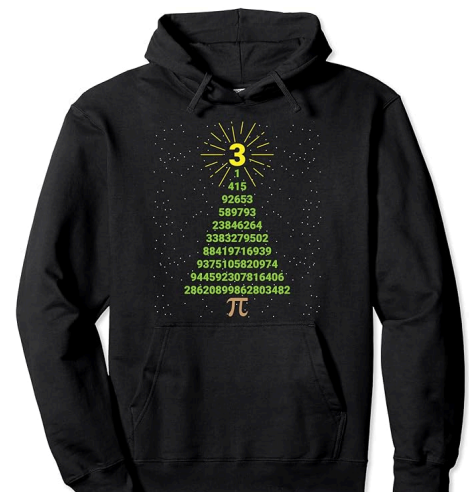
Weihnachts-Pulli für Nerds