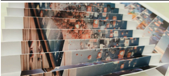
die eine Seite