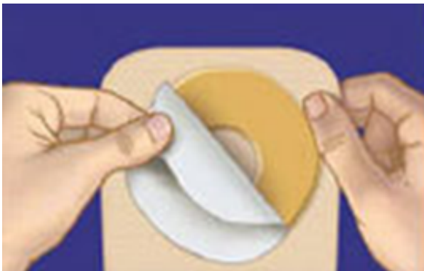
Schritt 1 der Stomapflege

Man sollte Pflegeprodukte benutzen um die Haut um das Ileostoma zu schützen und zu pflegen.