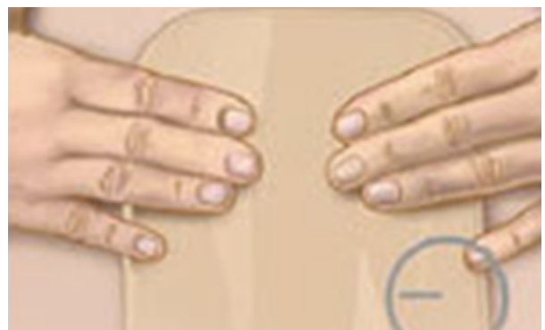
Der 6 Schritt der Stomapflege