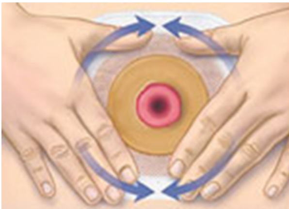
Schritt drei der Stomapflege