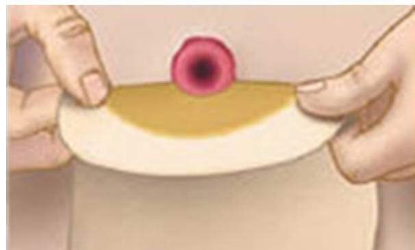
Schritt 2 der Stomapflege