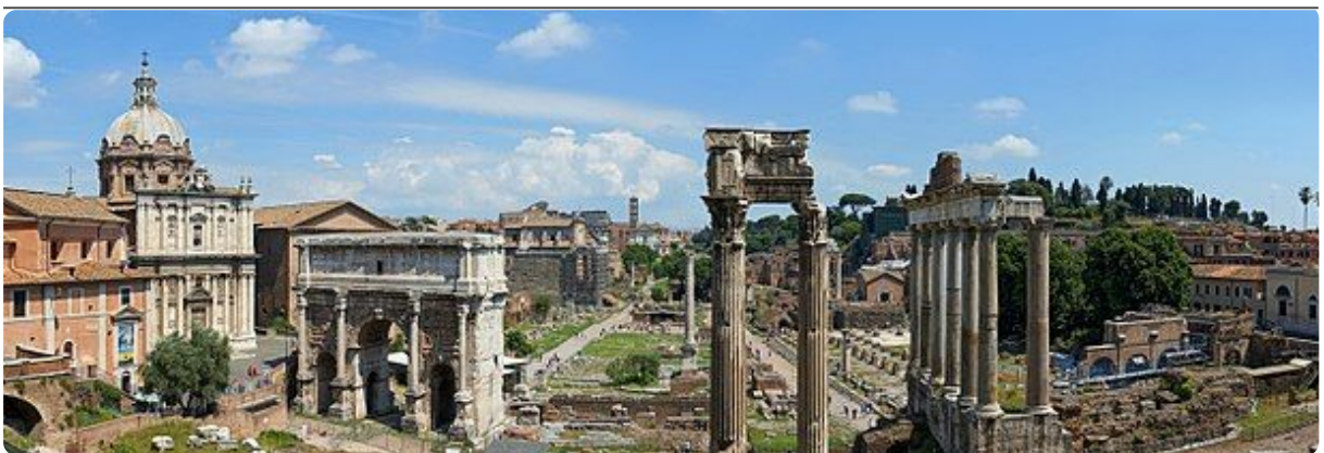
M22: Forum Romanum, 2012