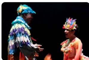
Papageno und Papagena aus Mozarts Oper ?

S A L I E R I F M E N U E T T A R M E N G R A B G K L A V I E R Y T O T E N M E S S E P A P S T E O K Ö C H E L Y I F Z A U B E R F L Ö T E G W I T E U R O P A R E I S E C R E Q U I E M X J I G M O Z A R T E U M A R I A T H E R E S I A A E E K O N S T A N Z E Q Z Z M L E O P O L D N O N S E R E N A D E L N A N N E R L S A L Z B U R G