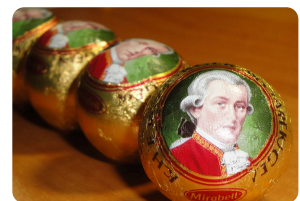
In der ganzen Welt beliebt → die ?