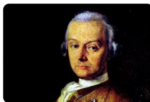
Leopold Mozart war Musiker und ?