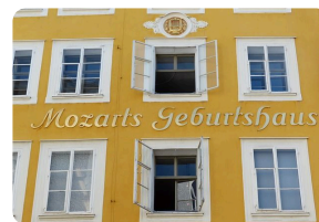
Mozarts Geburtshaus in der ? in Salzburg