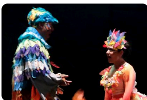
Papageno und Papagena aus Mozarts Oper ?

S A L I E R I F M E N U E T T A R M E N G R A B G K L A V I E R Y T O T E N M E S S E P A P S T E O K Ö C H E L Y I F Z A U B E R F L Ö T E G W I T E U R O P A R E I S E C R E Q U I E M X J I G M O Z A R T E U M A R I A T H E R E S I A A E E K O N S T A N Z E Q Z Z M L E O P O L D N O N S E R E N A D E L N A N N E R L S A L Z B U R G