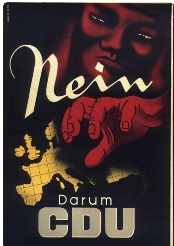
Q3 Wahlplakat CDU zur Bundestagswahl 1949