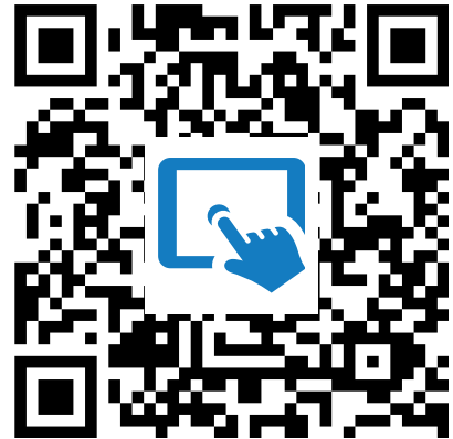
W1 Digitale Tafel