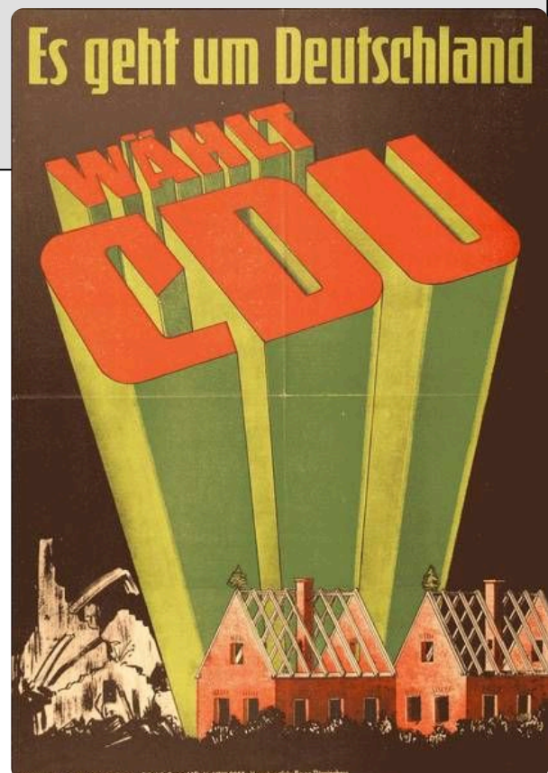
Q1 CDU-Wahlplakat der Bundestagswahl 1949

Damit ist das Plakat ein Medium der kommerziellen, kulturellen und politischen Öffentlichkeit und ein Instrument in der Konkurrenz um gesellschaftliche Aufmerksamkeit.