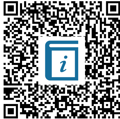
M2 Historische Plakate