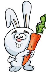
der (ein) Hase

Die meisten können im Singular und im stehen. Ein anderes Wort für Singular ist . Plural wird auch als bezeichnet. Der Singular gibt an, dass eine Sache lediglich vorkommt. Der Plural zeigt an, dass etwas vorhanden ist.