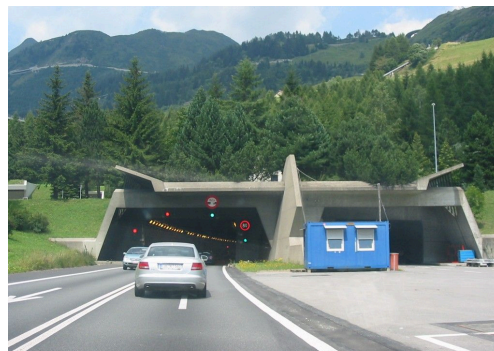
Gotthard Road Tunnel Switzerland; by Grzegorz Świącz; CC BY 3.0 license