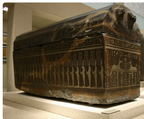
M6: Sarkophag Schatzmeister Ankh-Hor