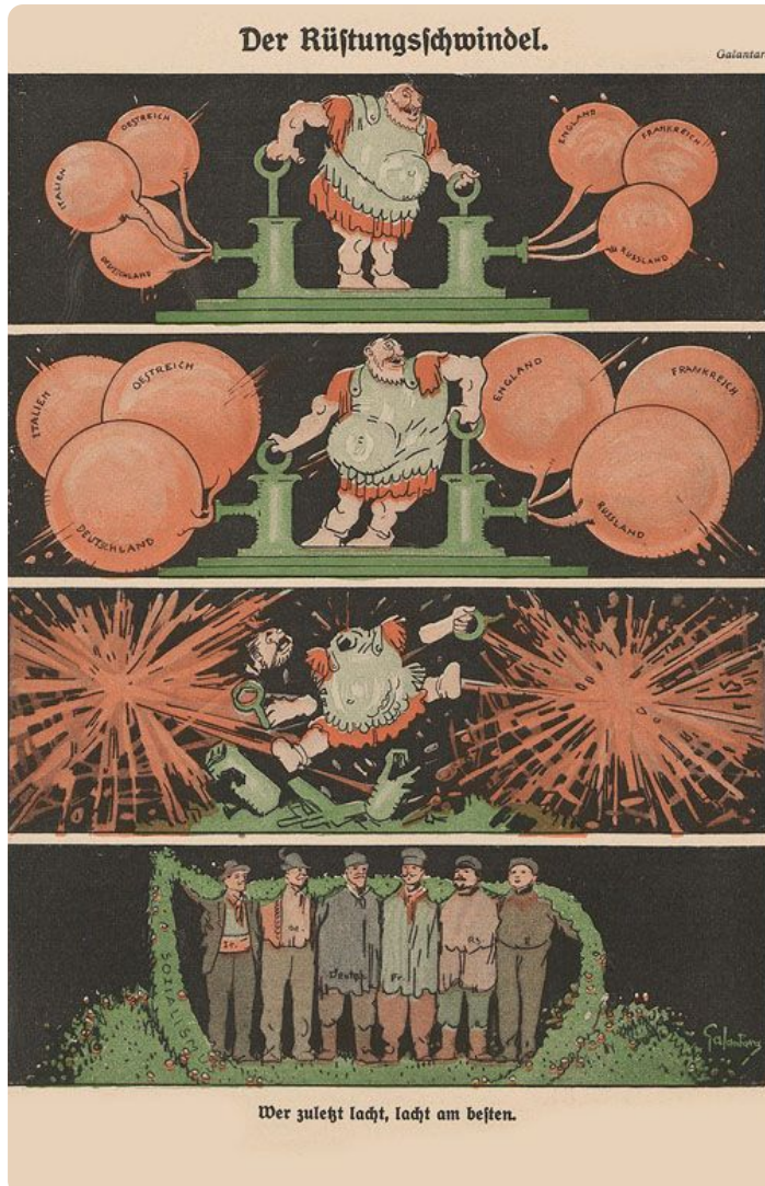
Q5: Gabriele Galantara in: Der wahre Jacob, 1913