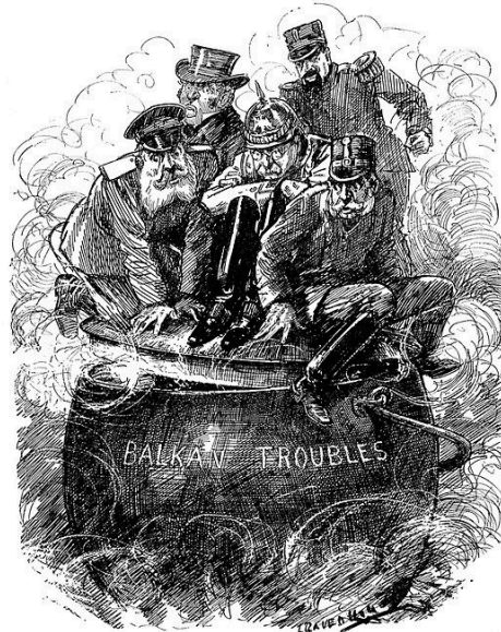
THE BOILING POINT.