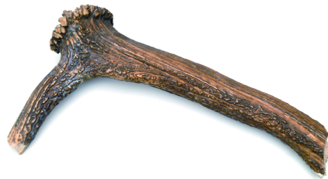
Ein Pickel aus Hirschgeweih

Ich bin eines der ältesten Fundstücke aus Hallstatt. Vor 7000 Jahren wurde ich als Pickel im Salzbergwerk verwendet.