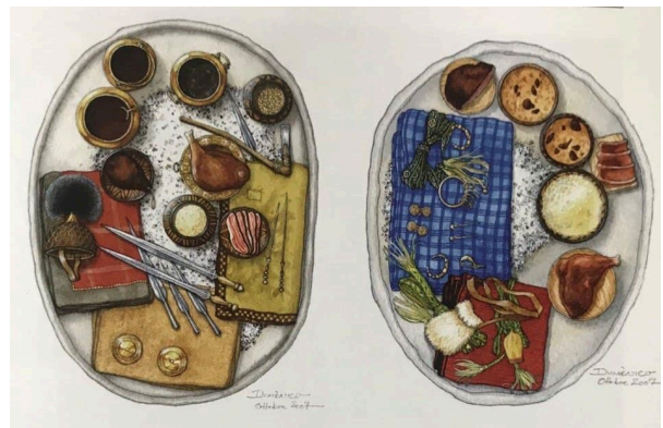
Zwei Gräber mit Grabbeigaben

In Hallstatt gab es Grab- und Brandbestattungen. Den Gestorbenen wurde neben Kleidung auch Waffen und Nahrung mit ins Jenseits gegeben.