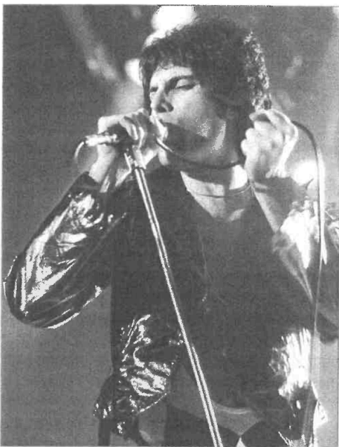
Freddie Mercury, Komponist und Leadsänger der Band Queen