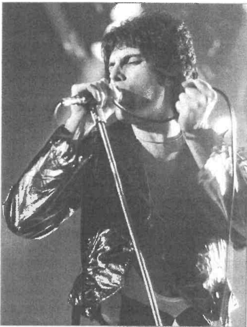
Freddie Mercury, Komponist und Leadsänger der Band Queen