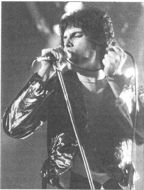
Freddie Mercury, Komponist und Leadsänger der Band Queen