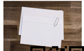
e- Karte Karte, -s

Einige Karteikarten zum Text „Verschiedene Musikinstrumente“ können z.B. so aussehen: