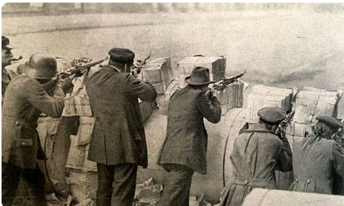
Bild: Barrikade während des Spartakusaufstandes , Wikimedia, Verlag J. J. Weber in Leipzig, Public domain, https://t1p.de/fh7w

Lade deinen Beitrag anschließend auf das Padlet M3 hoch.