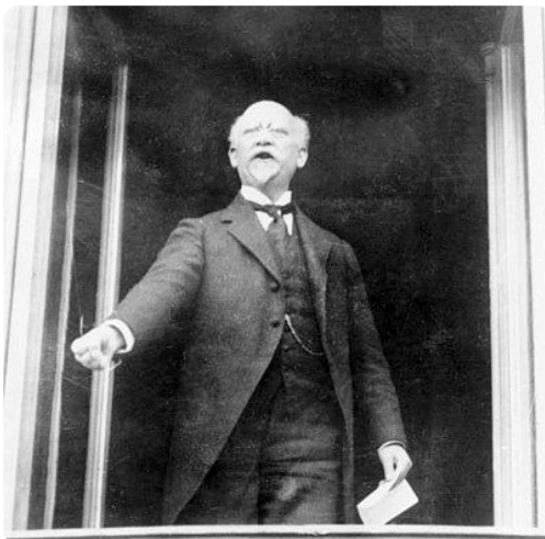
Bild: Philipp Scheidemann in der Reichskanzlei in Berlin