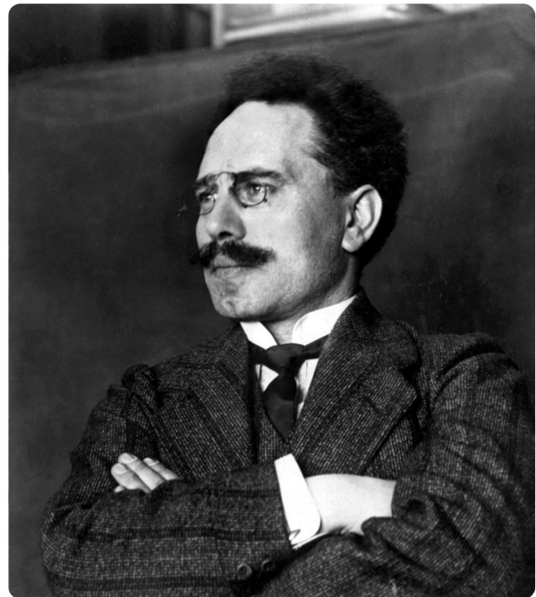
Portrait Karl Liebknecht