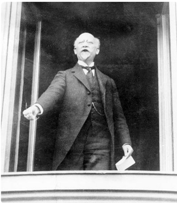
Bild: Philipp Scheidemann in der Reichskanzlei in Berlin