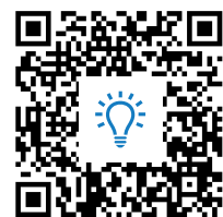
M3: Padlet https://t1p.de/bh58