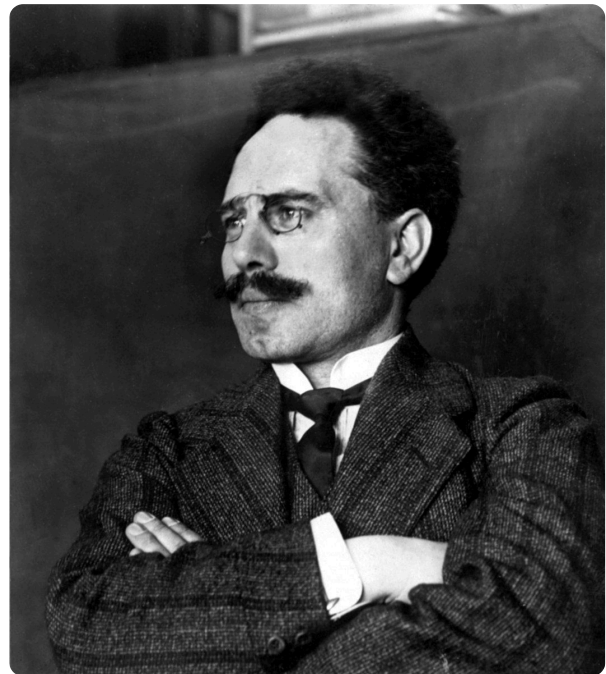
Bild: Portrait Karl Liebknecht