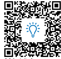
M1: Lückentext Ereignisse 1918 https://t1p.de/hybg