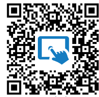
M2: Spiel der Lebenswege https://t1p.de/ntx1