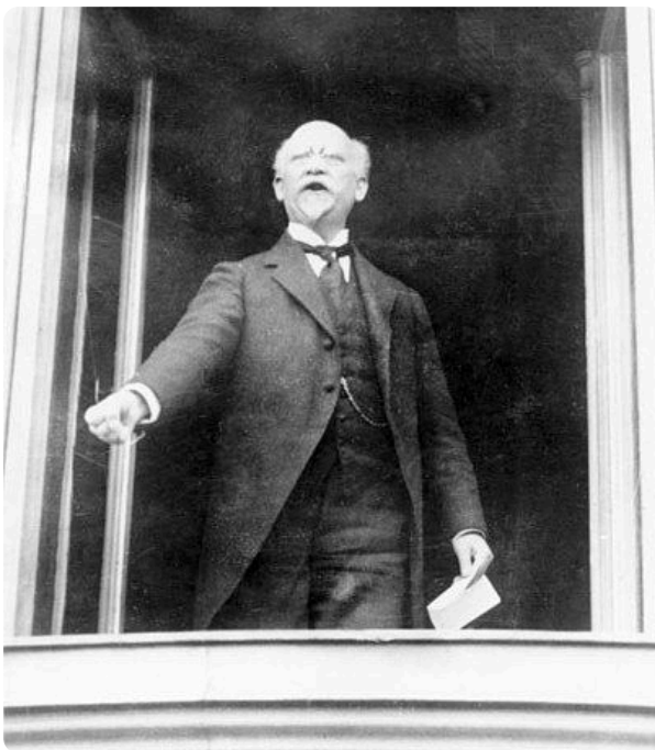
Bild: Philipp Scheidemann in der Reichskanzlei in Berlin