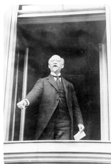
Bild: Philipp Scheidemann in der Reichskanzlei

9. November 1918: Ausrufung der Republik in Berlin