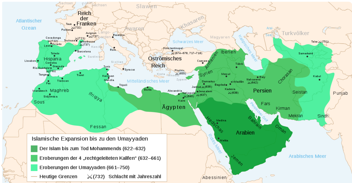
M7 Karte: Ausbreitung des Islam 622-750 Wikipedia, t1p.de/21w1 , CC0

Du hast soeben den Aachener Dom als Beispiel für die Christianisierung im Mittelalter kennen gelernt. Ab der Mitte des 7. Jahrhunderts breitete sich auch der Islam in Teilen Europas aus, vor allem in Spanien.