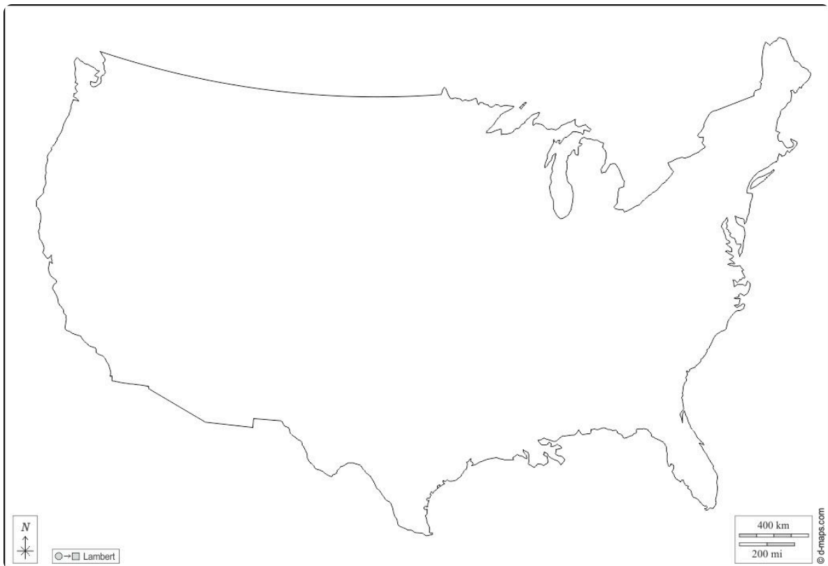
K1: „stumme“ Karte USA