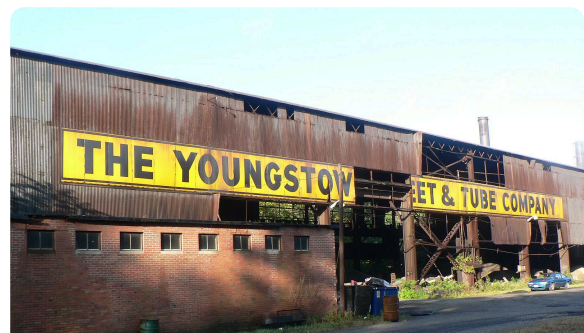
M4: Ehemalige Fabrik in Youngstown, Wikimedia, stu_spivack, CC-BY-SA 2.0 https://t1p.de/youn