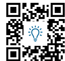
M7: Online-Artikel „Freiheits- und Einheitsdenkmal“ https://t1p.de/5p2e

Informiere Dich im Online-Artikel M7 über die Intention des Projekts und über die Rezeption des Siegerentwurfs „Bürger in Bewegung“.