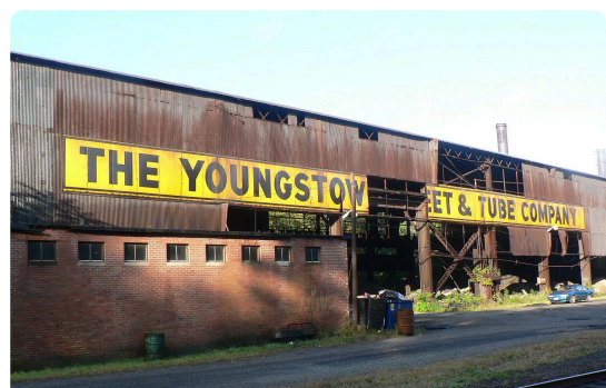
M4: Ehemalige Fabrik in Youngstown