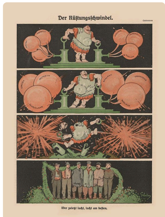
Q5: Karikatur Rüstungsschwindel in Der wahre Jacob 1913 von Gabriele Galantara, UB Heidelberg CC-BY-SA 4.0, https://t1p.de/3l2f

Du kannst die Karikatur finden, indem du nach der Autorin von Q5 im Reiter "Personenliste" suchst.